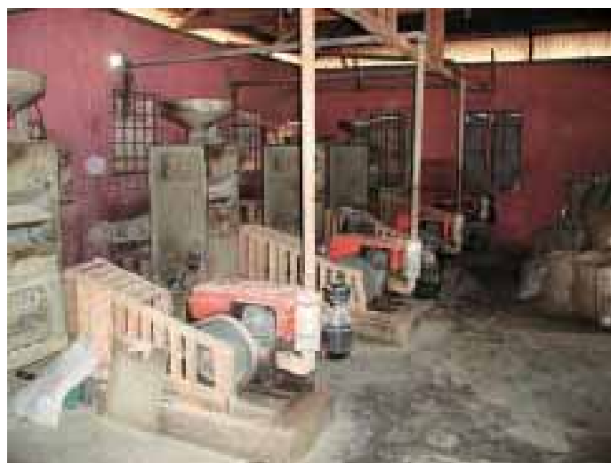
Il existe une technologie améliorée pour la transformation, mais elle n'est pas utilisée à ses capacités optimales à cause du manque d'incitation à produire des grains de haute qualité

L'amélioration de la compétitivité des systèmes locaux peut s'expliquer, d'une part, par l'amélioration de la productivité et d'autre part, par la réduction des coûts de production. La dépréciation des monnaies ouest-africaines face au dollar américain et la tendance à la hausse constatée dans les prix du riz au début des années 1990 ont été des facteurs qui ont contribué à cet état de fait.