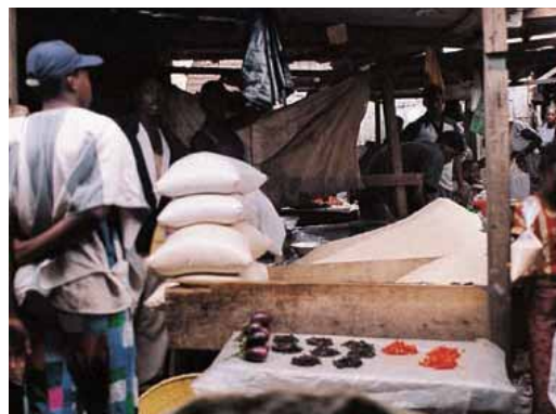
Même après avoir gagné la bataille contre les maladies, les insectes et les adventices dans les champs, sur le marché, le riz local peut encore ne pas être en mesure de concurrencer avec les produits importés.

Dans l'arène globale du dialogue des politiques, l'ADRAO a certains avantages par rapport aux systèmes nationaux, précisément à cause de son statut et de son rôle dans la sous-région. De manière spécifique, l'ADRAO est un centre de recherche ayant pour mandat de conduire des recherches sur le riz y compris des recherches sur les politiques. Elle est aussi une association intergouvernementale de pays membres, en tant que telle, elle a le soutien politique de