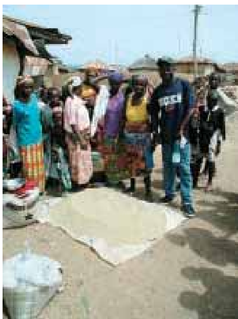
Le séchage du riz dans des rues poussiéreuses l'expose à la poussière et aux cailloux, ce qui réduit la qualité sur le marché