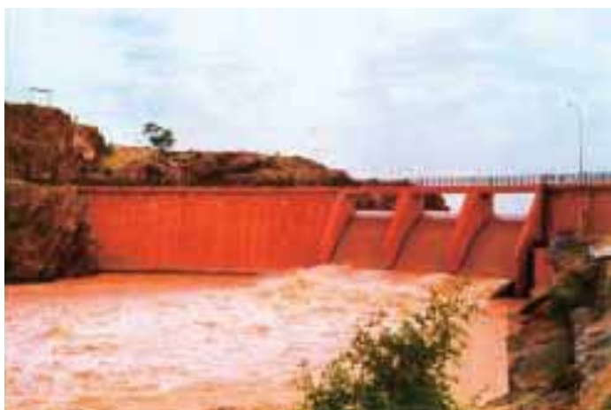
La grande visibilité était recherchée tant par les gouvernements nationaux que par les donateurs

mettre en place un système durable principalement parce qu'ils imposaient leurs idées aux paysans locaux et géraient tout eux-mêmes. Quand ils sont partis, ils ont emporté avec eux leur savoir-faire et tout s'est effondré. Mais, ce qui est sûr, c'est que la Révolution verte était toute autre chose ... n'est-ce pas ?