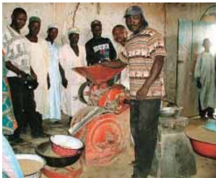
Au Nigéria, l'essentiel de la capacité de transformation est assuré par des petites unités de transformation

Avec un financement de l'USAID, l'ADRAO s'est lancée dans une importante revue de la filière riz au Nigéria sur la base de cette approche holistique (voir Encadré 'Etude de cas : le Nigéria'). « Si nous pouvons obtenir une intégration des sous-secteurs au Nigéria et mettre en place des politiques appropriées pour l'ensemble de la filière riz, nous aurons un modèle à appliquer ailleurs dans la sous-région et au-delà », a conclu Lançon.