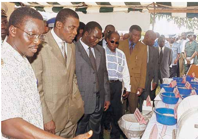
S.E. Pascal Affi N'Guéssan, Premier Ministre de Côte d'Ivoire, (deuxième à partir de la gauche), visite l'exposition du 30 ème anniversaire de l'ADRAO

représentants du PNUD ont noté que depuis l'approbation officielle du projet CBSS en 2001, aucun fonds n'a été débloqué. L'ADRAO a été dûment mandatée pour apporter son appui dans les domaines suivants : (1) planification des activités CBSS pour les mois à venir ; (2) remplissage des formulaires de demande de fonds en relation avec les activités à mener (ateliers de mise en route, ateliers dans les champs paysans et ateliers de sensibilisation et suivi des activités, formation des personnes ressources pour les régions retenues de Bouaké, Daloa, Man, Korhogo) ; (3) préparation de l'atelier de mise en route (4) préparation des contrats officiels pour différentes catégories d'acteurs impliqués dans le projet CBSS (ANADER, CNRA [Centre national de recherche agronomique], ADRAO, PNR, LANADA [Laboratoire national d'appui au développement agricole], ONG et secteur privé). En outre, l'ADRAO devra (a) faciliter la mise en œuvre immédiate du programme CBSS en Côte d'Ivoire ; (b) produire le matériel didactique ;