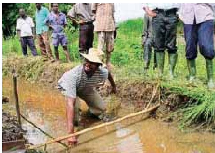
Apprentissage participatif et recherche action, Bamoro, Côte d'Ivoire

Une équipe de 'Association for International Cooperation of Agriculture and Forestry (AICAF, Japon) a visité le siège de l'ADRAO le 1 er août dans le cadre du suivi du projet