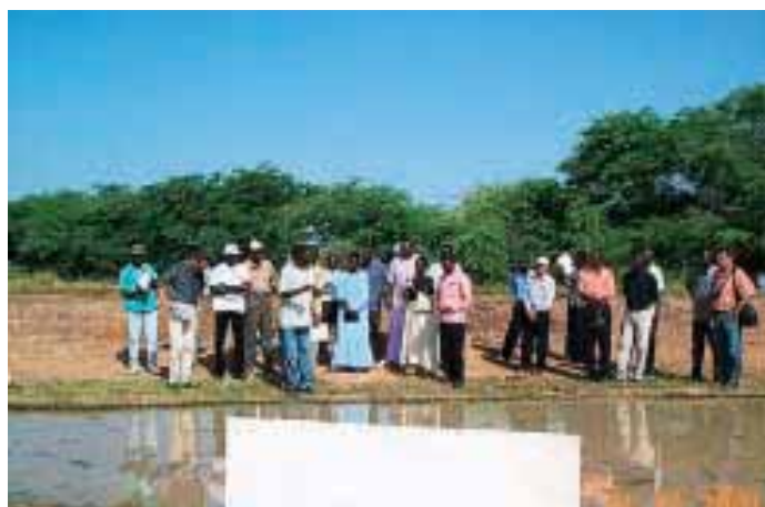
Journée porte ouverte à la Station Sahel de l'ADRAO, octobre 2001

Un atelier des acteurs riz a été organisé du 8 au 9 novembre à Ibadan, Nigeria, sous les auspices du Nigerian Rice Sector Study par le Nigerian Institute of Social and Economic Research (NISER) et l'ADRAO. Les participants à l'atelier – choisis dans toute la gamme des acteurs riz du pays – ont discuté des contraintes au développement du secteur