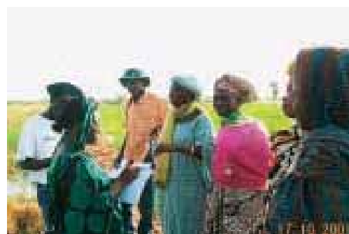
Une scène de la tournée d'évaluation du ROCARIZ/ INGER-Afrique/ PRIGA dans l'écologie rizicole irriguée du Sahel, Mauritanie, octobre 2001

Du 21 au 22 septembre, l'ADRAO a célébré son 30 ème anniversaire à son siège. Lors de la cérémonie d'ouverture, cinq membres du personnel ont reçu des distinctions