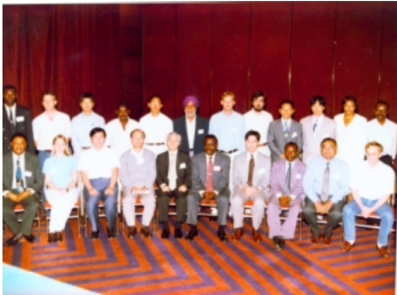
Juste une partie du vaste réseau que constitue l'équipe du PHI : l'ADRAO, les chercheurs collaborateurs, les représentants des donateurs et le personnel d'appui ayant pris part à l'évaluation à mi-parcours du projet en 1998

Avec ce type de perspective, il n'est pas surprenant que la phase II du projet PHI attire plus de donateurs que tout autre projet de l'Association.