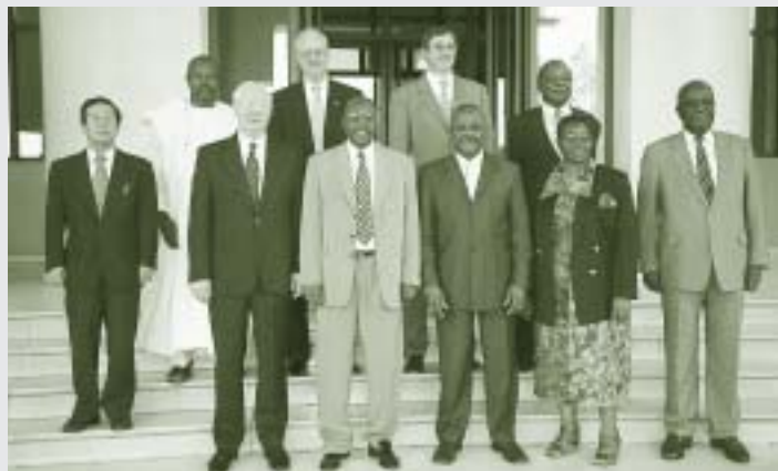
Le Conseil d'administration avec Son Excellence Seydou Traore, Ministre de l'Agriculture, de l'Elevage et des Pêches, Gouvernement du Mali (premier rang, 2e à gauche)

23e Réunion du Conseil d'administration, Bamako, Mali, 24–28 février 2003