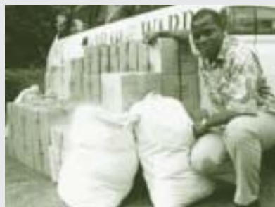
Récupération d'échantillons duplicata de variétés de riz de la banque de gènes de l'ADRAO pour les stocker en dehors de la zone à risque.